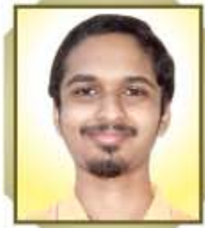
Mann Manoj Maru Malad - Lakhapur St. Anne's