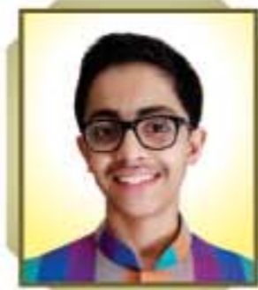
Rushil Ashwin Satra Shivaji Park - Gundala Shishuvan