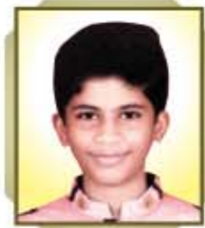
Tirth Atul Gada Ghatkopar - Merau SVDD